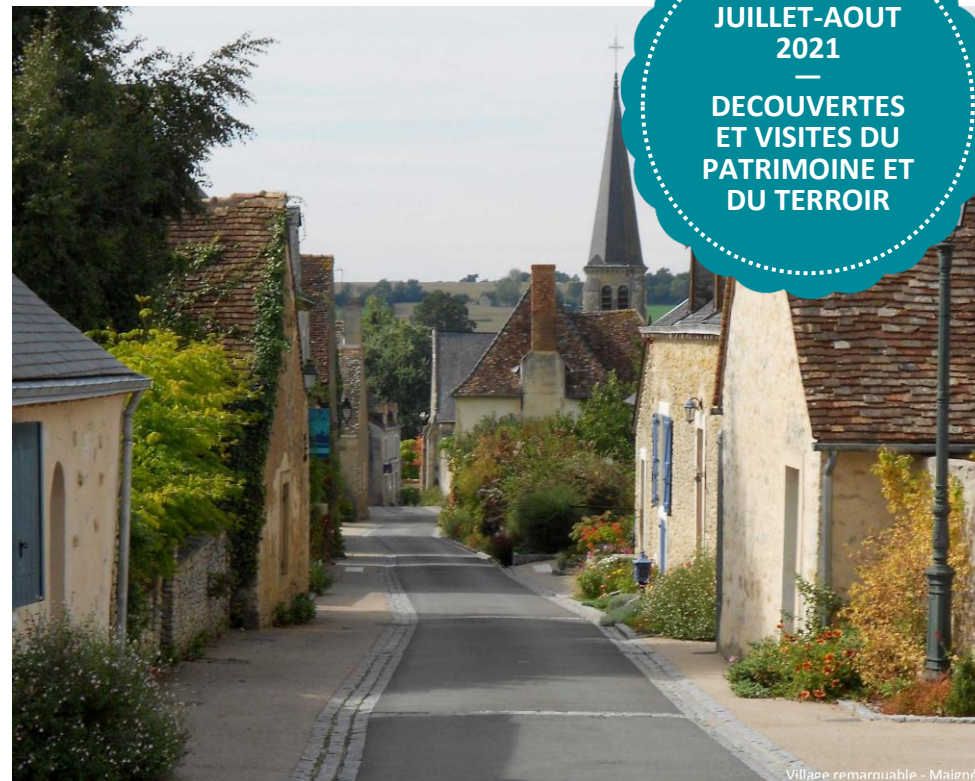
Village remarquable - Maigné

UNE TERRE POUR CHANGER D' AIR | WWW.VALLEE-DE-LA-SARTHE.COM