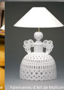
Faienceries d'Art de Malicorne