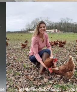
« les Bellès des champs » - Loué