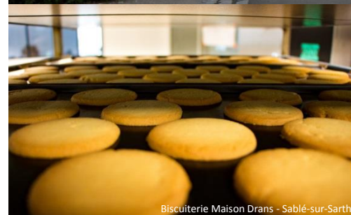
Biscuiterie Maison Drans - Sablé-sur-Sarthe